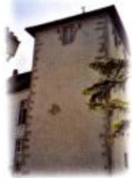
Ancien Hôtel de Ville (10)