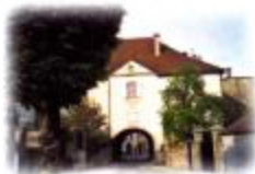
Le Porche (2)