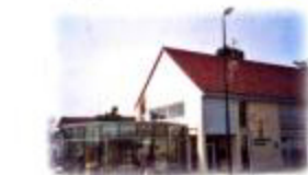
Point Information Tourisme (1)