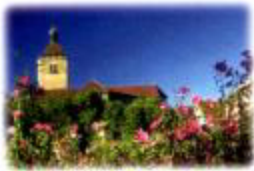
Eglise "Notre Dame"(12)