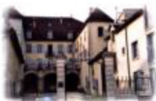
L'hôtel Babey (3)