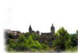
Vue depuis un jardin (9)