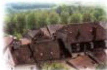
Vue sur les vieux toits (6)