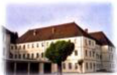
Le Collège Brézillon (4)