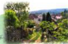
Descente entre les jardins (9)