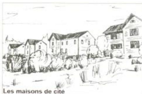
Les maisons de cité

9. Descendre la route jusqu'au carrefour. On longe la villa des liserons et l'ancienne école, beaux exemples d'architecture néo-classique. Au carrefour, à gauche, retour en direction de la mairie.